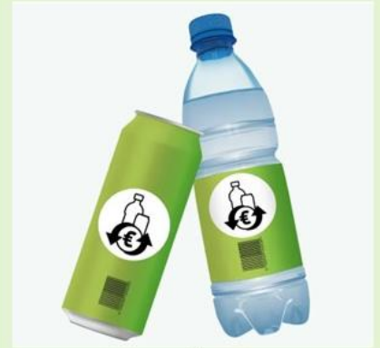
Grafik: EWP Recycling Pfand Österreich gGmbH